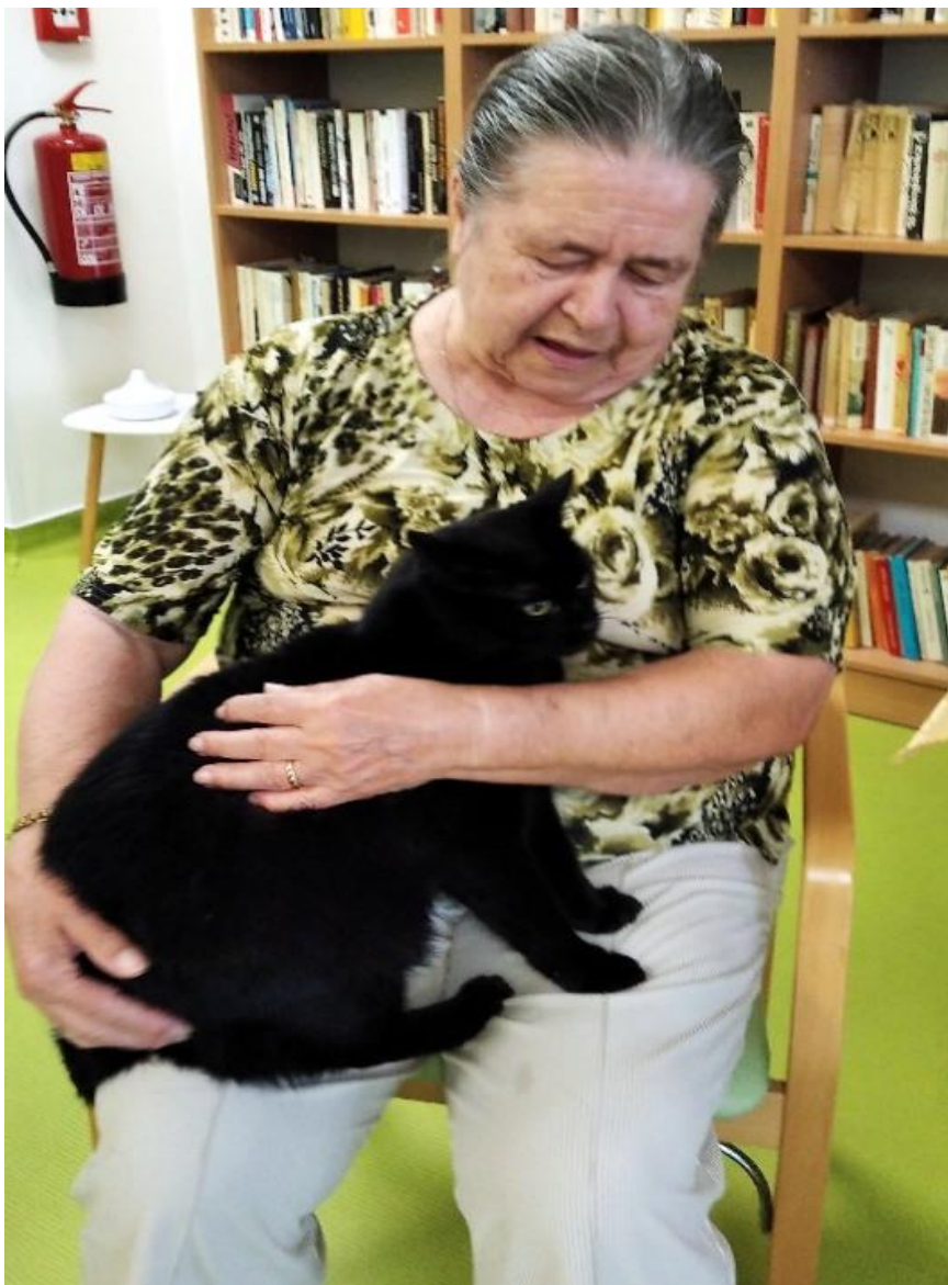
Klientka při Felinoterapii s kocourkem Čikem

Velmi oblíbenou je u nás v SeniorCentru i Felinoterapie , která podobně jako Canisterapie patří mezi Zooterapie, ale tentokrát jde o přímý kontakt klienta s kočkou. O tom, že úsměv léčí, není vůbec pochyb a naši klienti se vždy těší na další zvířecí návštěvy.